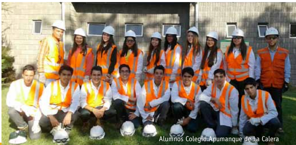
Alumnos Colegio Apumanque de La Calera